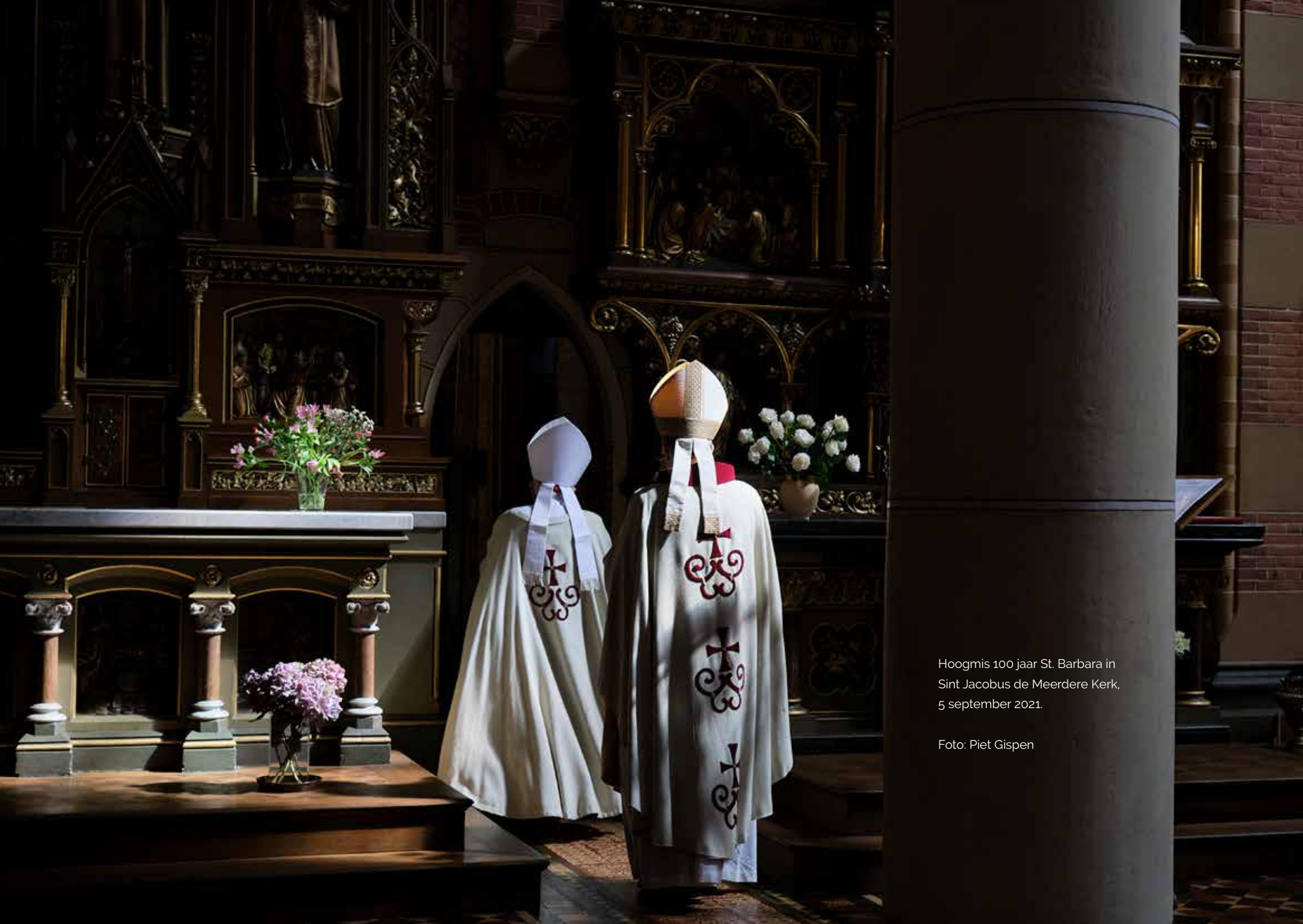
Hoogmis 100 jaar St. Barbara in Sint Jacobus de Meerdere Kerk, 5 september 2021.