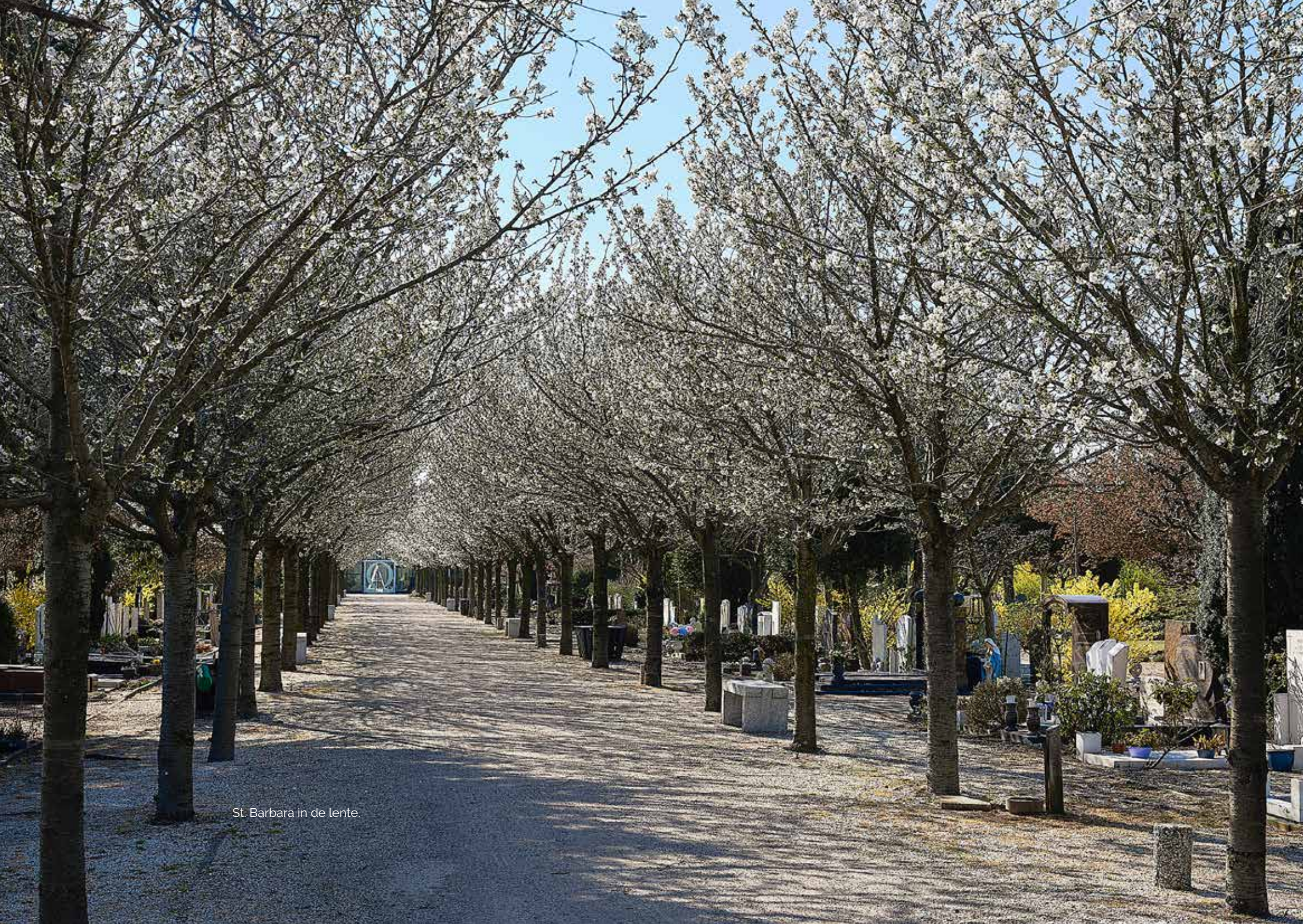
St. Barbara in de lente.